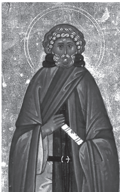
Преподобный Моисей Мурин, икона

С Моисеем произошло нечто подобное тому, что испытал святой Давид: однажды его сердце вострепелось от всего зла, что было содеяно в жизни, и одновременно почувствовало сострадание и милосердие Бога ко всякому грешнику. История умалчивает, после какого происшествия случилось его обращение. Но под действием благодати раскаяния он решительно оставил разбойничью шайку и ушел в один из пустынных монастырей. Ему пришлось продолжительно, со слезами умолять монахов причислить его к братии.