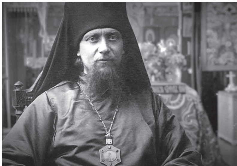
Епископ Ковровский Афанасий (Сахаров), 1920-е гг.

заклучения и ссылки он ежедневно неизменно совершал богослужения, помня обширные молитвы и стихиры служб на память. Всегда строго соблюдал пост. Служить он старался в любых условиях, как бы ни было тяжело. Даже возвращаясь в камеру после очередных пыток, сдерживая стоны, он произносил привычное: «Давайте помолимся, похвалим Бога». И запевал песнопение Утрени, полиелей: «Хвалите имя Господне». Вновь прибывших узников он вдохновлял подобным же образом: «Давай похвалим Бога. По Своей великой милости Господь тебя сподобил немного за Бога пострадать. Благодари Бога, благодари Бога». И опять же начинал петь Богу благодарственные гимны, их подхватывали другие узники, и при этом все приходило в состояние необычайного утешения души.