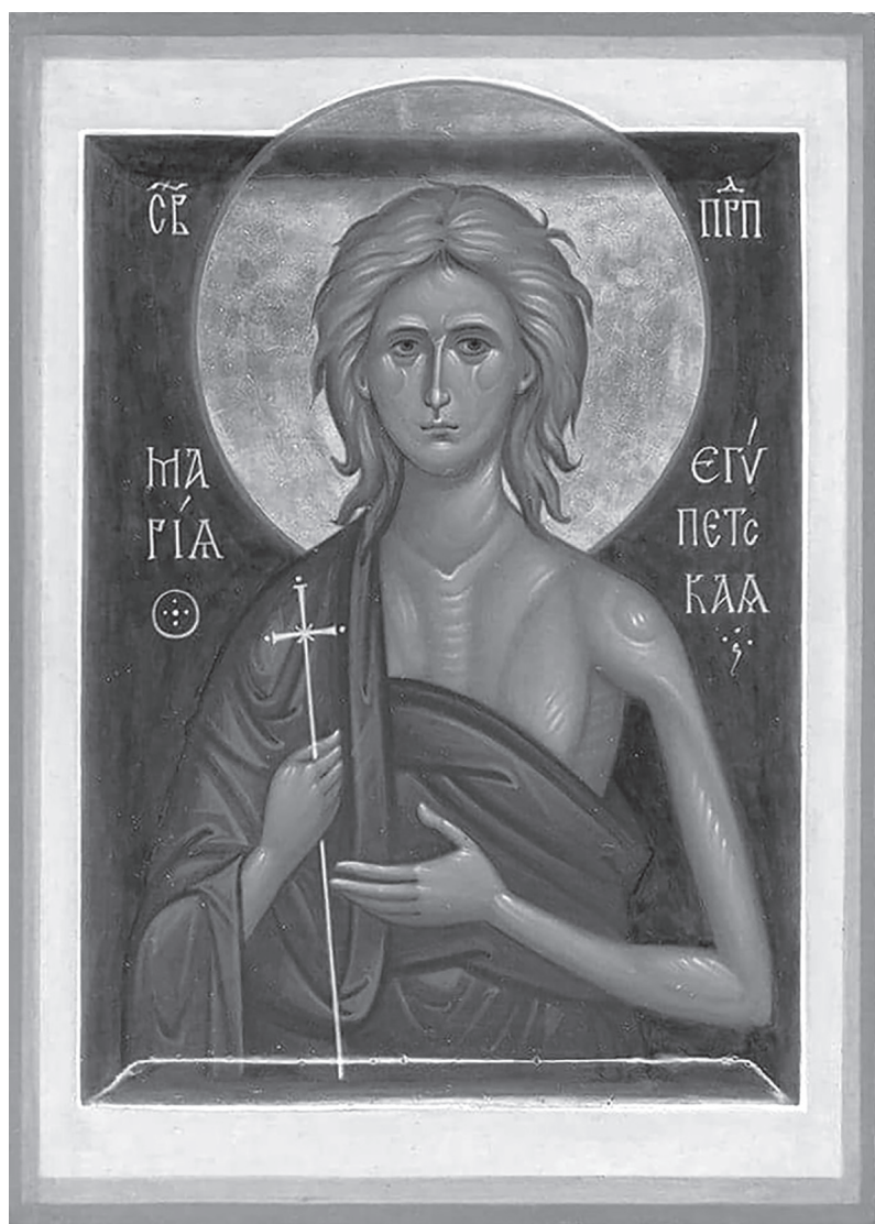
Преподобная Мария Египетская, икона