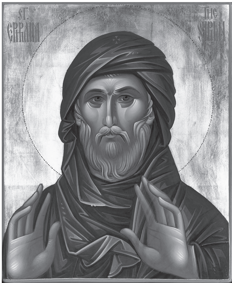
Преподобный Ефрем Сирин, икона

Ефрем стал расспрашивать других невинно заключенных, не имеют ли они каких дурных дел, за которые не получили должного воздаяния. Один из них, обвинявшийся в убийстве, вспомнил, что однажды не спас тонущего человека, хотя мог. Второй, обвиненный в прелюбодеянии, вспомнил, как ого-