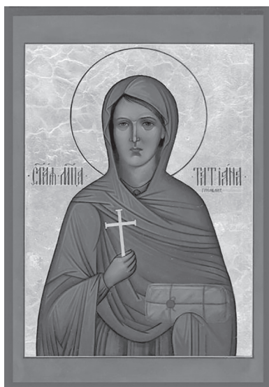
Новомученица Татьяна Гримблит, икона из храма Бутырской тюрьмы

Третий арест Татьяны пришелся на 1926 год. К этому времени она познакомилась со многими архиереями и священниками Русской Православной