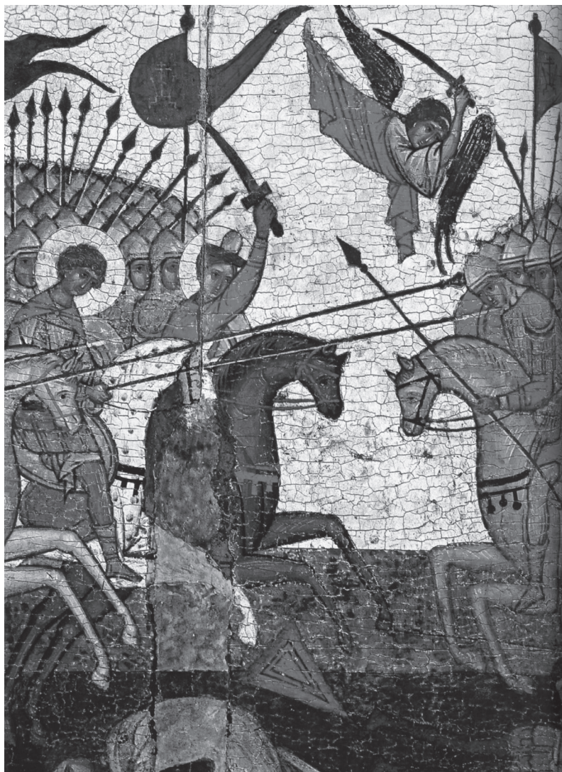
Фрагмент иконы «Чудо от иконы «Богоматерь Знамение»», битва новгородцев с суздальцами во время осады Новгорода войском суздальского княжича Мстислава Андреевича, XV век.