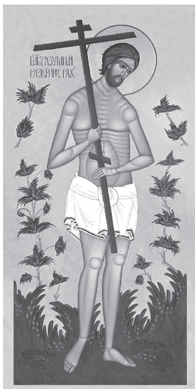
Благоразумный разбойник Рах, икона

править свою жизнь через добродетели в силу обстоятельств он уже не мог. Разбойник успел только прозреть и увидеть две вещи. Первое – то, что его страдания в казни справедливы и искупают содеянные преступления, принося ему пользу. Второе – он первым на Голгофе исповедует Христа Богом, признавая реальность Его Царствия, о котором написано на Его Кресте («Царь Иудейский»). «Помяни мя, Господи, когда прийдешь во Царствие Твое» (Лк, 23, 42), – с такой молитвой обращается благоразумный разбойник